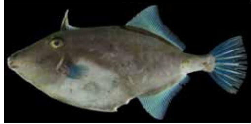
Fig. 2. Fresh specimen of Thamnaconus modestus from Kagoshima Bay, Kagoshima Prefecture, Japan. KAUM-I. 71405, 241.6 mm SL.

Thamnaconus modestoides は Zama and Yasuda (1979) によって小笠原近海から得られた2個体 (MTUF 23091, 体長 259.0 mm, MTUF 23775, 体長 230.0 mm) に基づき, 日本から初めて報告され, 同時に本種に対し, 和名キビレカワハギが提唱された. 小笠原諸島における本種の分布は, 菅野ほか (1980) や Randall et al. (1997) によっても報告されている. また, キビレカワハギは神奈川県三浦半島 (山田・工藤, 1997), 和歌山県白浜町 (松浦, 1997; 池田・中坊, 2015), みなべ町 (池田・中坊, 2015), 高知県土佐清水市以布利 (鐘, 2001), 九州西方の東シナ海 (Shinohara et al., 2005), および八丈島 (Senou et al., 2002) などからも報告されて