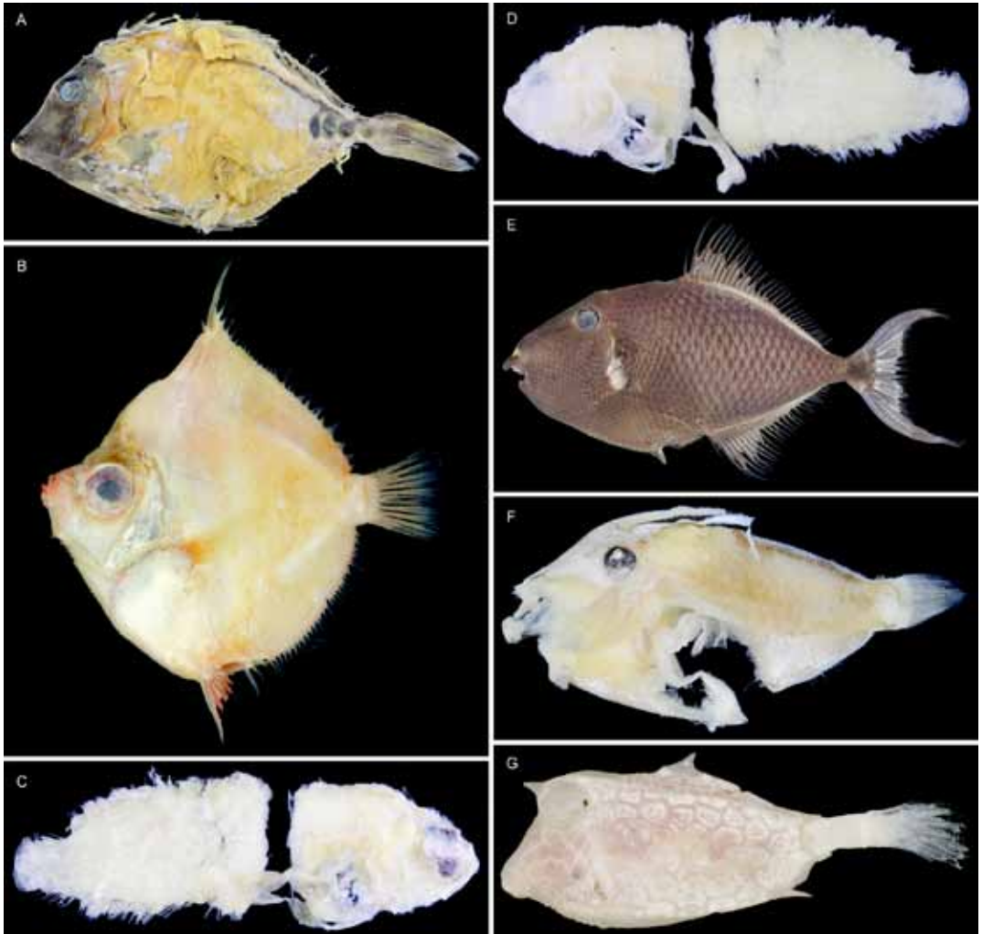
Fig. 4. Fish specimens taken from fish stomach deposited at the Kagoshima University Museum – 4. A: Prionurus scalprum , KAUM-I. 79718, 165.0 mm SL; B: Antigonia capros , KAUM-I. 73688, 129.0 mm SL; C: unidentified genus and species of Samaridae, KAUM-I. 84227, 51.9 mm SL, preserved specimen; D: blind side, preserved specimen; E: Odonus niger , KAUM-I. 83082, 142.3 mm SL; F: Pervagor sp., KAUM-I. 84495, 45.7 mm SL, preserved specimen; G: Lactoria fornasini , KAUM-I. 89372, 72.5 mm SL.

島東岸・西岸，和歌山県串本，小笠原諸島から記録されていた（波戸岡，2013a）。種子島から得られた標本は，鹿児島県からの本種の初めての記録となる。