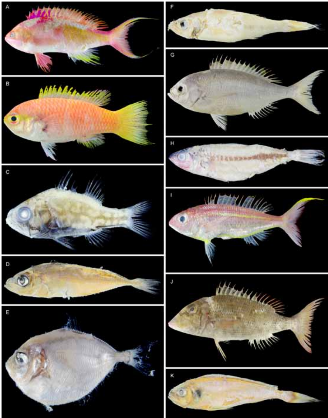
Fig. 2. Fish specimens taken from fish stomach deposited at the Kagoshima University Museum – 2. A: Pseudanthias cooperi , KAUM-I. 72431, 76.8 mm SL; B: Grammatonotus surugaensis , KAUM-I. 200100, 92.4 mm SL; C: Siphamia argentea , KAUM-I. 83034, 39.0 mm SL, preserved specimen; D: Trachurus japonicus , KAUM-I. 37919, 62.4 mm SL, preserved specimen; E: Brama orcini , KAUM-I. 74354, 27.0 mm SL; F: Etelis coruscans , KAUM-I. 73689, preserved specimen, 365.0 mm SL; G: Paracaesio caerulea , KAUM-I. 91566, 266.6 mm SL; H: Pterocaesio tile , KAUM-I. 86765, 214.6 mm SL; I: Nemipterus bathybius , KAUM-I. 97928, 151.0 mm SL; J: Lethrinus rubrioperculatus , KAUM-I. 88313, 247.5 mm SL; K: Larimichthys polyactis , KAUM-I. 64927, 120.2 mm SL, preserved specimen.