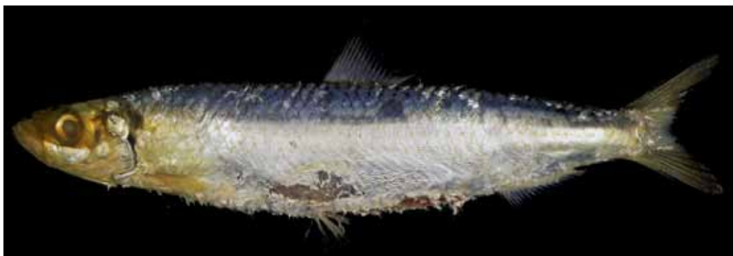
Fig. 1. Fresh specimen of Amblygaster leiogaster from Tanega-shima island, Osumi Islands, Kagoshima Prefecture, Japan (KAUM-I. 93637, 130.5 mm SL).

14；臀鰭不分枝軟条数 3，臀鰭分枝軟条数 16；胸鰭不分枝軟条数 1；胸鰭分枝軟条数 16；腹鰭不分枝軟条数 1；腹鰭分枝軟条数 7；尾鰭軟条数 19；第 1 鰓弓上枝鰓耙数 15；第 1 鰓弓下枝鰓耙数 32；第 1 鰓弓総鰓耙数 47；第 2 鰓弓上枝鰓耙数 14；第 2 鰓弓下枝鰓耙数 33；第 2 鰓弓総鰓耙数 47；第 3 鰓弓上枝鰓耙数 13；第 3 鰓弓下枝鰓耙数 25；第 3 鰓弓総鰓耙数 38；第 4 鰓弓上枝鰓耙数 11；第 4 鰓弓下枝鰓耙数 17；第 4 鰓弓総鰓耙数 28；第 3 上鰓骨後面上の鰓耙数 8；鰓条骨数 6；側線鱗数 40；擬鰓上の鰓弁数 20。体各部の体長に対する割合 (%)：背鰭前長 51.3；胸鰭前長 23.8；腹鰭前長 51.0；臀鰭前長 80.6；背鰭基底長 12.1；臀鰭基底長 12.3；尾柄長 10.7；尾柄高 7.5；眼窩径 7.4；眼径 5.7；吻長 7.1；胸鰭長 13.5；背鰭第 1 軟条長 1.8；背鰭第 2 軟条長 5.0；背鰭第 3 軟条長 8.4；臀鰭第 1 軟条長 0.5；臀鰭第 2 軟条長 5.0；臀鰭第 3 軟条長 8.4；頭高 14.6；眼隔域幅 3.5；上顎長 7.7；下顎長 9.3。体は円筒形に近く、やや側扁する。体の輪郭は背腹が同程度に膨らむ。体側鱗は円鱗で薄く、剥がれやすい。背鰭前方鱗は体の正中線上に配列する。各鰭は無鱗。上顎後端は眼の前縁直下に達する。上顎長は吻長の 108.0%。第 2 上主上顎骨は上下対称で、下半分は肥大しない。胸鰭基底上端は鰓蓋後端よりも僅かに後方に位置する。胸鰭後端は尖り、背鰭起部直下に達しない。背鰭起部は腹鰭起部よりも前方