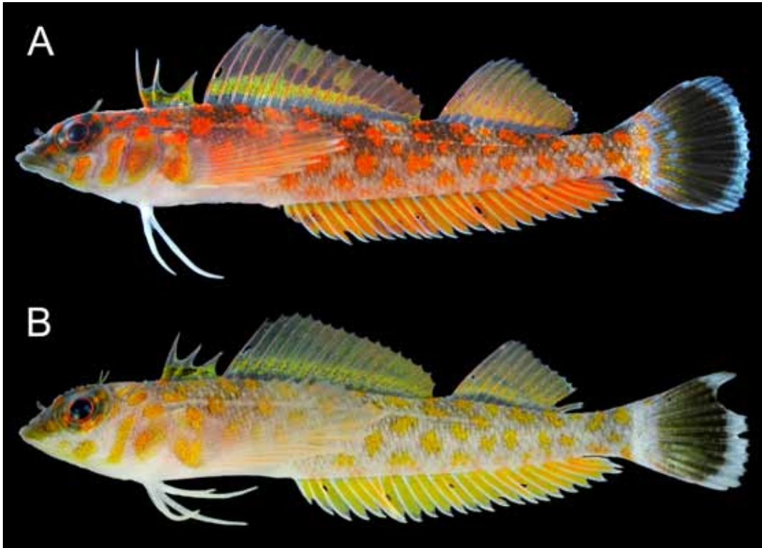
Fig. 1. Fresh specimens of Springerichthys bapturnus . A, KAUM-I. 89740, male, 38.4 mm SL, Kamikoshiki-jima, Koshiki Island, Kagoshima Prefecture, Japan ; B, KAUM-I. 61823, female, 27.3 mm SL, off Kamihuruta Fishing Port, Tanega-shima island, Kagoshima Prefecture, Japan.

27.3 mm, 種子島西之表市上古田漁港沖 (北緯 30 度 48 分, 東經 131 度 01 分), 水深 15 m, 田代郷国ほか, 2014 年 6 月 10 日.